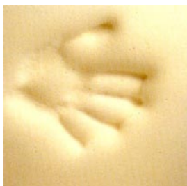
Prise d'empreinte et stabilisation