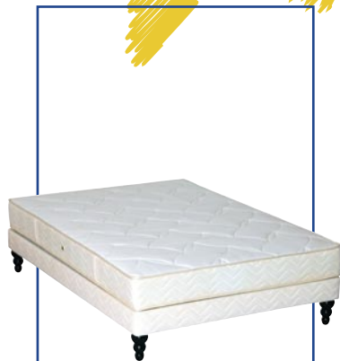
O'cor, le seul matelas à proposer une nouvelle technologie fondée sur un duo de matières inédit

Le 1er Expert Européen qui défend le droit de mieux dormir