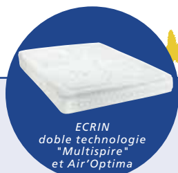
ECRIN doble technologie "Multispire" et Air'Optima

Le concept Air'Optima est unique et apporte un confort progressif et une relaxation totale.