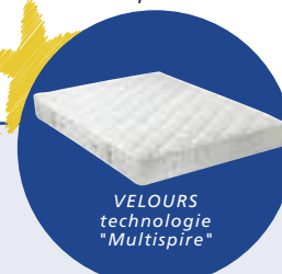
VELOURS technologie "Multispire"

L'alchimie des trois composantes offre un équilibre unique pour le sommeil.