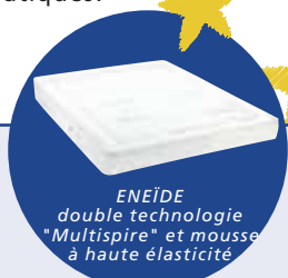
ENEÏDE double technologie "Multispire" et mousse à haute élasticité

Respiration : la technologie de ressorts ensachés Air'Optima consiste en une multitude de petits ressorts indépendants les uns les autres enveloppés dans du tissu comme autant de petits coussins moelleux.